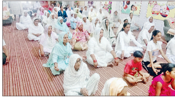
राजौंद। कार्यक्रम में भाग लेते हुए भाई बहन व ब्रह्माकुमारी बहन।