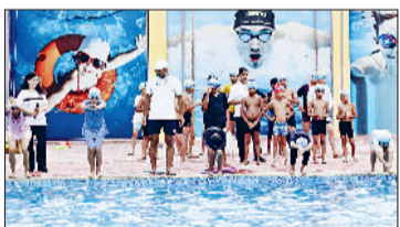
नरवाना। प्रतियोगिता में भाग लेते हुए बच्चे।

डीबीके इंटरनेशनल स्कूल नरवाना द्वारा आयोजित 21 दिवसीय मेगा समर कैंप का समापन समारोह अत्यंत भव्य और प्रेरणादायक रहा। इस समापन कार्यक्रम में सभी कैम्पर्स के अभिभावकों को आमंत्रित किया गया था। जिससे एक विशाल और उत्साहपूर्ण सभा ने इस कार्यक्रम को विशेष बना दिया। कार्यक्रम की शुरुआत शानदार सिविलिंग शो से हुई जिसमें छात्रों ने बेगिनर से लेकर एडवांस लेवल तक की तैरकी कोशल का अद्भुत प्रदर्शन किया। इसके बाद स्केटिंग शो में क्वाड्रा और इनलाइन स्केटिंग का जोरदार मुकाबला हुआ जिसमें बच्चों ने अपनी मेहनत और संतुलन का बेहतरीन परिचय दिया। कराटे शो में छात्रों ने कातास और आत्मरक्षा की तकनीकों को प्रस्तुत किया जिसे देखकर सभी अभिभावक मंत्रमुग्ध रह गए। इसके पश्चात म्यूजिकल