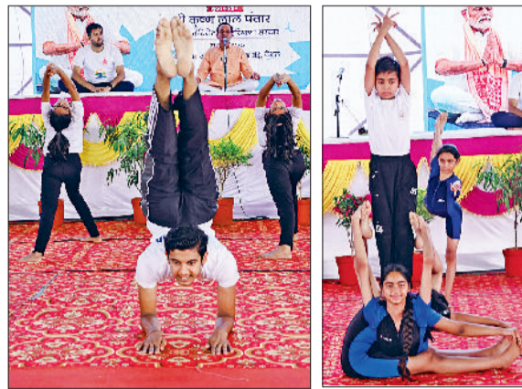
कैथल। योग के करतब दिखाते विद्यार्थी।

उन्म में योग ऐसी ही एक जीवन शैली है, जिसको अपनाकर व्यक्ति के जीवन में सकारात्मकता संभव है। योग दिवस पर आज पूरा विश्व योगमय हो रहा है। इस बात का श्रेय देश के यशस्वी, कर्म योगी एवं दूरदर्शी सोच के धनी प्रधानमंत्री माननीय नरेंद्र मोदी को जाता है। योग सीखने की लालसा कई विदेशियों को भारत की ओर खींच