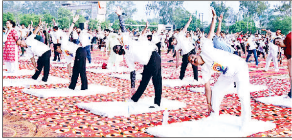
जीद। सीआरएसयू में आयोजित जिलास्तरीय योग कार्यक्रम में योग करते योग साधक व मंत्री कृष्ण बेदी।