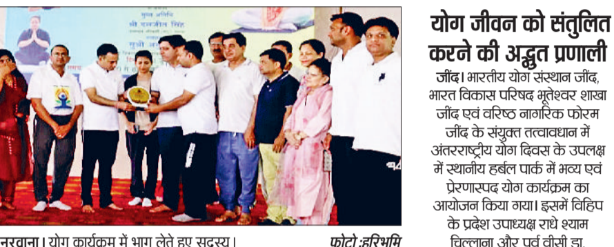
नरवाना। योग कार्यक्रम में भाग लेते हुए सदस्य।

करना चाहिए ताकि शरीर निरोग रहे। पीएम नरेंद्र मोदी की अगुवाई में आज विश्व में योग किया जाता है विश्व के काफी देशों में आज योग हो रहा है। कुरुक्षेत्र में सीएम नायब सिंह सैनी ने योग गुरु रामदेव के साथ शिरकत की। स्कूलों से विद्यार्थियों की भी भागीदारी योग में हुई है।