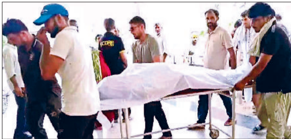
जींद। नागरिक अस्पताल में मृतक के शव का एक्सरे करवाने ले जाते हुए।