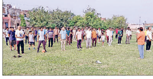
जीद। योग करते हुए साधक।