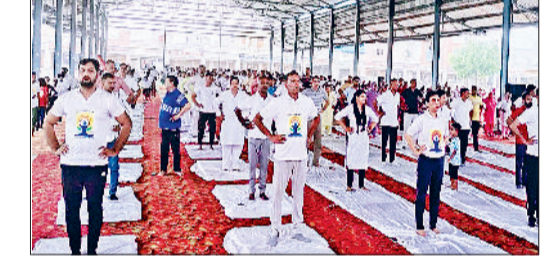
जुलाना। कार्यक्रम में योग करते लोग।