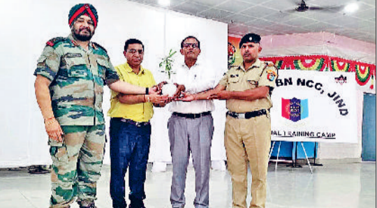
जीद। वीसी को सम्मानित करते आयोजक।