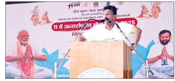
जीद। सीआरएसयू में जिला स्तरीय कार्यक्रम को संबोधित करते मंत्री कृष्ण बेदी।