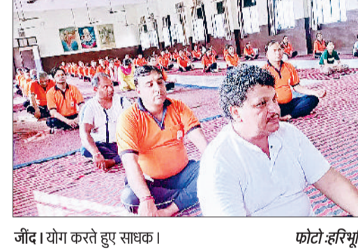
जीद। योग करते हुए साधक।