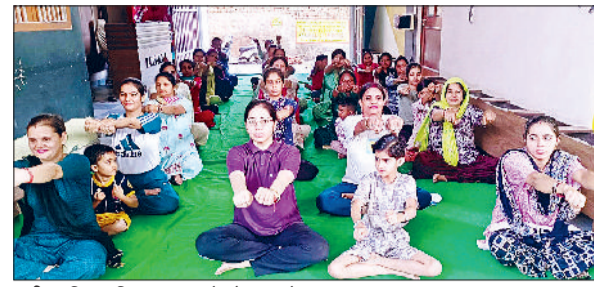
जीद। शिव पब्लिक स्कूल में योग करते साधक